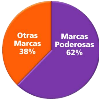
Porcentaje de las Ventas Netas 2014

En 2014, nuestras Marcas Poderosas, las cuales representan casi el 60 por ciento de los ingresos totales netos, continuaron impulsando las ventas y crecieron a una tasa casi dos veces tan rápida como la compañía total.